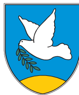
Občina · Comune di IZOLA · ISOLA